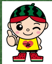
富里市社会福祉協議会 マスコットキャラクター さとしくん