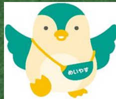
めいやす ペンタン