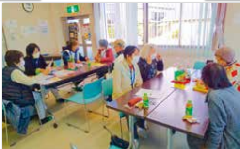
ケアカフェ菜の花