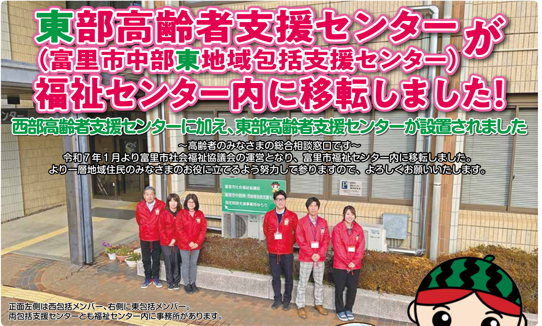
正面左側は西包括メンバー、右側に東包括メンバー。 両包括支援センターとも福祉センター内に事務所があります。

令和7年1月より富里市社会福祉協議会の運営となり、富里市福祉センター内に移転しました。 より一層地域住民のみなさまのお役に立てるよう努力して参りますので、よろしくお願いたします。