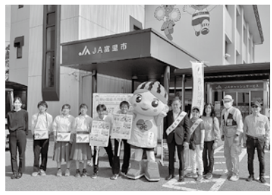
J A 富里市産直センター1号店 さんでの街頭募金活動