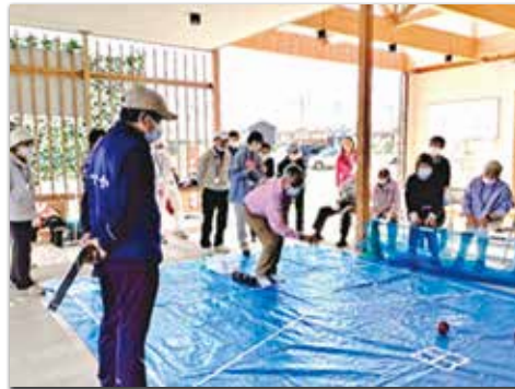
末廣ボッチャ大会