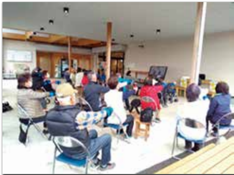
末廣ちよきん体操