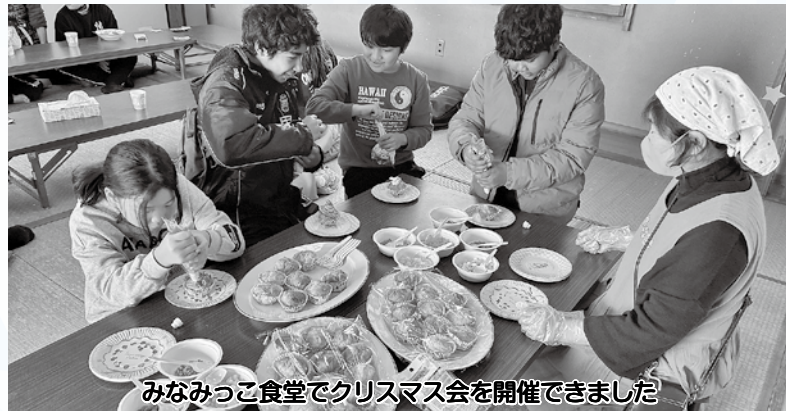
みなみっこ食堂でクリスマス会を開催できました

①地域ふれあい事業：市内の社会福祉施設・地区社会福祉協議会・ボランティアグループが年末年始に実施する地域住民やボランティアとの交流会を目的とした独自の事業に対し、助成金として配分させていただきました。