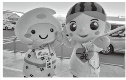
今回初めての試みとして、白井市支会さんとの合同街頭募金活動を実施しました