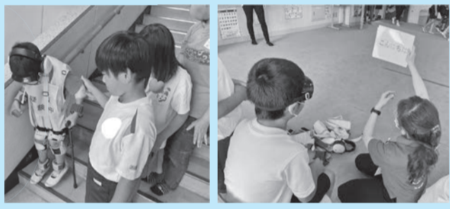
福祉教育推進事業

募金の約3割は大規模災害発生時の準備金の積立てに活用されるほか、千葉県域の福祉活動支援にも活かされています。県を通じて富里市内で活動するNPO法人や福祉施設などにも、車両整備などの助成が行われています。