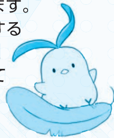
福祉教育推進事業

県を通じて富里市内で活動するNPO法人や福祉施設などにも、車両整備などの助成が行われています。