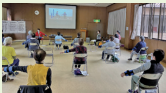
重りを付けての体操にも慣れてきました

富里市西部高齢者支援センター ☎(92)2776 (富里市中部西地域包括支援センター)