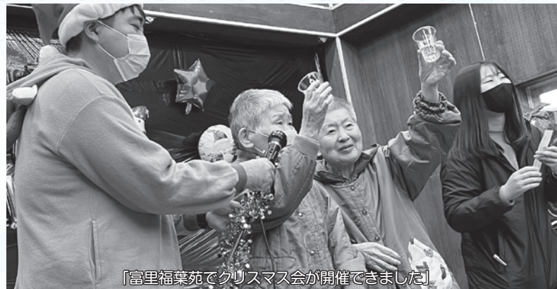
「富里福葉苑でクリスマス会が開催されました」

①地域ふれあい事業：市内の社会福祉施設・地区社会福祉協議会・ボランティアグループが年末年始に実施する地域住民やボランティアとの交流会を目的とした独自の事業に対し、助成金として配分させていただきました。