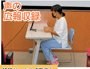
朗読サークル「青空」