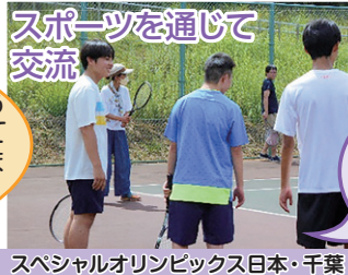
スペシャルオリンピックス日本・千葉 (テニスプログラム)

収録時、ミスをしないかとても不安だったけど、上手にできてとても嬉しかったです。次もまたやりたいです。