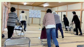
中沢ちょきん体操クラブの様子