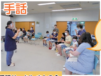
手話サークル さとの会

今年度は、とみさと市民活動サポートセンターと共催で体験期間を長く設けました。富里市ボランティアセンターでは、ボランティアグループ9団体の協力を頂き、コロナ禍の中ですが多くの参加がありました。その活動の一部をご紹介します。