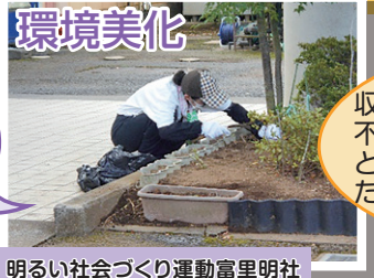
明るい社会づくり運動富里明社

ボランティア活動は、地域だけでなく人の心も豊かにする素晴らしい活動なんだと実感することができました。