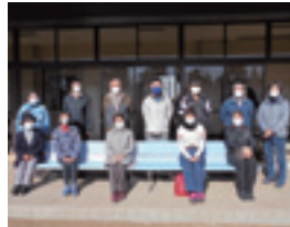
「作りたてをお届けしています」配食ボランティアのみなさん