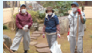
福祉センターの中庭