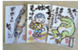
「絵手紙サークルつくしんぼ」の絵手紙