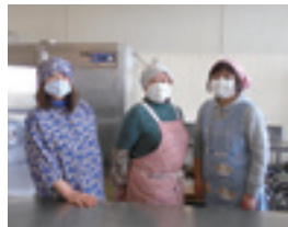
「優しい味を作ります」調理ボランティアのみなさん