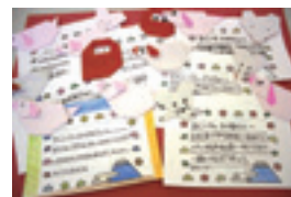
根木名小のお手紙