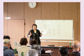
富里市消費生活センターの講演