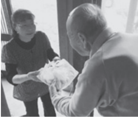
調理ボランティアさんが作ったお弁当を配食ボランティアさんが届けています。 【給食サービス】