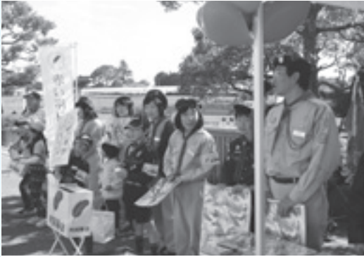
今年もボーイスカウト富里第一団と富里高校JRC部が、福祉まつり及び産業まつりでそれぞれ募金の協力を呼びかけます。

市内の福祉団体・施設などへの助成、ゲートボール大会やグラウンドゴルフ大会の開催、ひとりで暮らしている高齢者へお弁当の給食サービス、福祉まつりの開催、広報紙の発行、災害見舞金などに活用させていただいております。