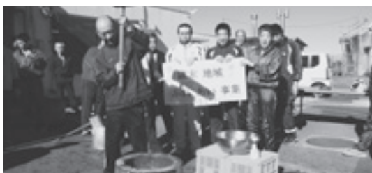
富里第一地区社会福祉協議会主催 富里福葉苑の方々と「交流餅つき大会」【地域ふれあい事業】

市内の社会福祉施設、社会福祉を目的とするNPO法人、地区社会福祉協議会が、年末年始に実施する独自の地域福祉サービス事業や地域住民・ボランティアとの交流会事業に対し助成金として配分し、社会福祉活動へのより一層の理解と協力を図ります。