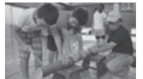
浩養地区社会福祉協議会の世代間交流「竹とんぼ作り」