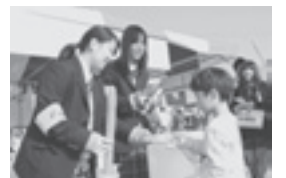
富里高校JRC部による「赤い羽根共同募金運動」