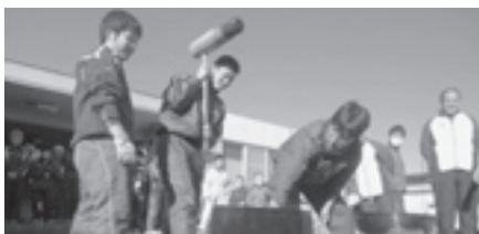
富里第一地区社会福祉協議会主催「富里福葉苑餅つき」より【地域ふれあい事業】

市内の社会福祉施設、社会福祉を目的とするNPO法人、地区社会福祉協議会が年末年始に実施する独自の地域福祉サービス事業や地域住民・ボランティアとの交流会事業に対し助成金として配分し、社会福祉活動へのより一層の理解と協力を図ります。