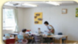
九十九荘デイサービスでの様子「お茶はいかがですか?」