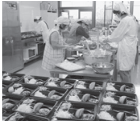
ボランティアさんが作ったお弁当を預かり、ボランティアさんが届けています【給食サービス】

厚生労働大臣の告示により、今年で68回目を迎え全国一斉に募金運動が展開されています。