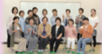
11月3日の福祉まつり「ファミリーサポートセンターコーナー」にて保育実技で習ったペットボトルけん玉を作ります。ぜひ遊びにきてくださいね!!