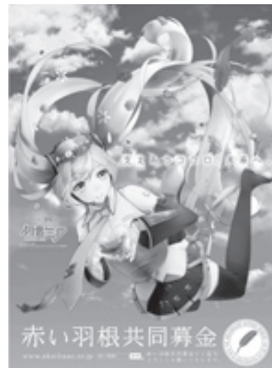
illustration by 羽雪 piapro © Crypton Future Media, INC. www.piapro.net