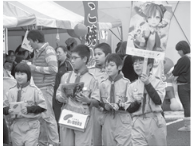
今年もボーイスカウト富里第一団が、福祉まつりで募金の協力を呼びかけます。募金をいただいた方に『初音ミク』か『戦国BASARA4』のクリアファイルを先着限定でプレゼントします。